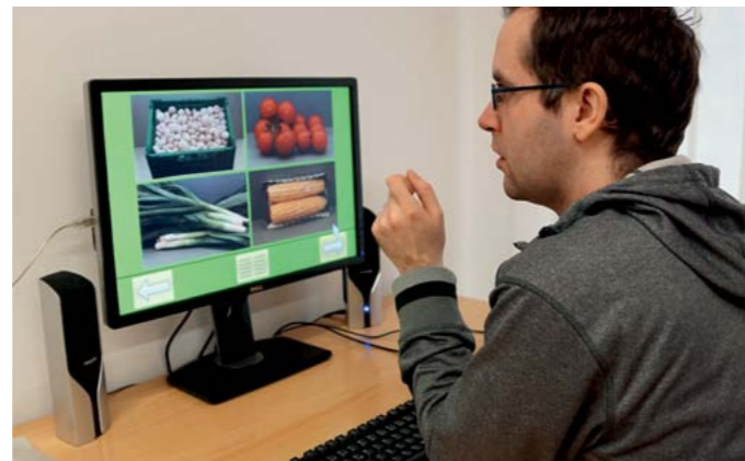
Modern ausgestattet: Computergestütztes Hirnleistungstraining

Wir bieten eine individuell ausgerichtete, alltagsnahe Unterstützung unter Berücksichtigung von ganzheitlichen Förderplänen, die auf neurowissenschaftlicher Forschung und rehabilitativen Kenntnissen beruhen. Dieses Wohnangebot ist zeitlich befristet und hat im besten Fall den Umzug in eine eigene Wohnung bzw. zurück in die bisherige Wohnform zum Ziel.