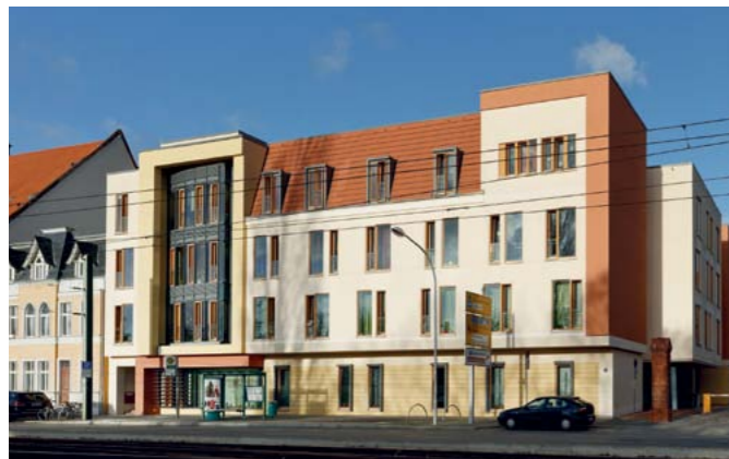
Gut gelegen: Der Babelsberger Park und das Stadtzentrum sind in wenigen Minuten zu erreichen.

Das Gebäude entspricht den Bedürfnissen von Menschen mit Körper- und Mehrfachbehinderungen.