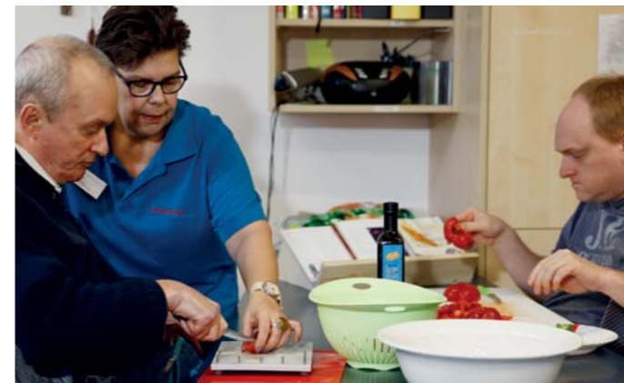
Umfassende Förderung der kognitiven und motorischen Fähigkeiten

Unser Ziel ist es, dass die Klientinnen und Klienten unter Wahrung ihrer Menschenwürde, der Achtung der Persönlichkeit und unter Berücksichtigung der individuellen Bedürfnisse ein selbstbestimmtes Leben führen können. Unsere Arbeit orientiert sich stets an den individuellen Interessen der Klientinnen und Klienten und ermöglicht Teilhabe in allen Lebenslagen. Der Wohnbereich besteht aus drei Wohnungen.