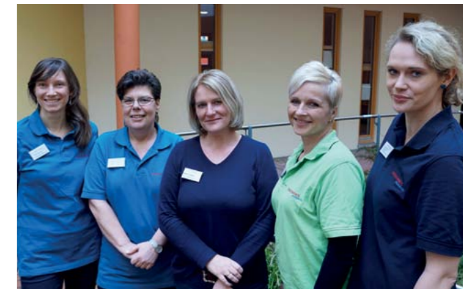
Bestens aufgestellt im Wohnverbund: Unser interdisziplinäres Team.

Ziel ist es, den pflegebedürftigen jungen Menschen mit hohem Unterstützungsbedarf ein Zuhause zu bieten, welches ihnen eine Lebensperspektive mit bestmöglicher Pflege, Sicherheit und Lebensqualität ermöglicht.