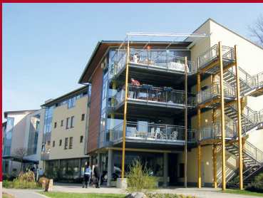
Ihr Team des Kloster Ebernach

den Menschen nahe ... ist der Leitgedanke des Kloster Ebernach, einer Einrichtung in Trägerschaft der Franziskanerbrüder vom Heiligen Kreuz, in der Menschen mit geistiger Behinderung unterschiedlichster Art und Ausprägung leben. Die Konzepte der vielseitigen und individuellen Wohnangebote für Menschen mit Hilfebedarf und/oder Behinderung bauen auf diesem Leitgedanken auf und ermöglichen eine eigenständige Lebensführung und Förderung in allen persönlichen Bereichen. Kloster Ebernach begleitet volljährige Frauen und Männer in ihrem Alltag und bietet ein Zuhause, in dem die Bedürfnisse und Wünsche des Einzelnen im Vordergrund stehen. Den Menschen nahe ... bedeutet auch Teilhabe und Normalität. Unter Berücksichtigung dieser Grundsätze werden unsere Bewohnerinnen und Bewohner eng in Arbeits- und Beschäftigungsangebote einbezogen und können vielfältige und individuelle Freizeit- und Fördermöglichkeiten nutzen. Wir laden Sie herzlich ein, unsere Einrichtung persönlich kennen zu lernen und stehen Ihnen für Fragen und Anregungen gerne zur Verfügung.