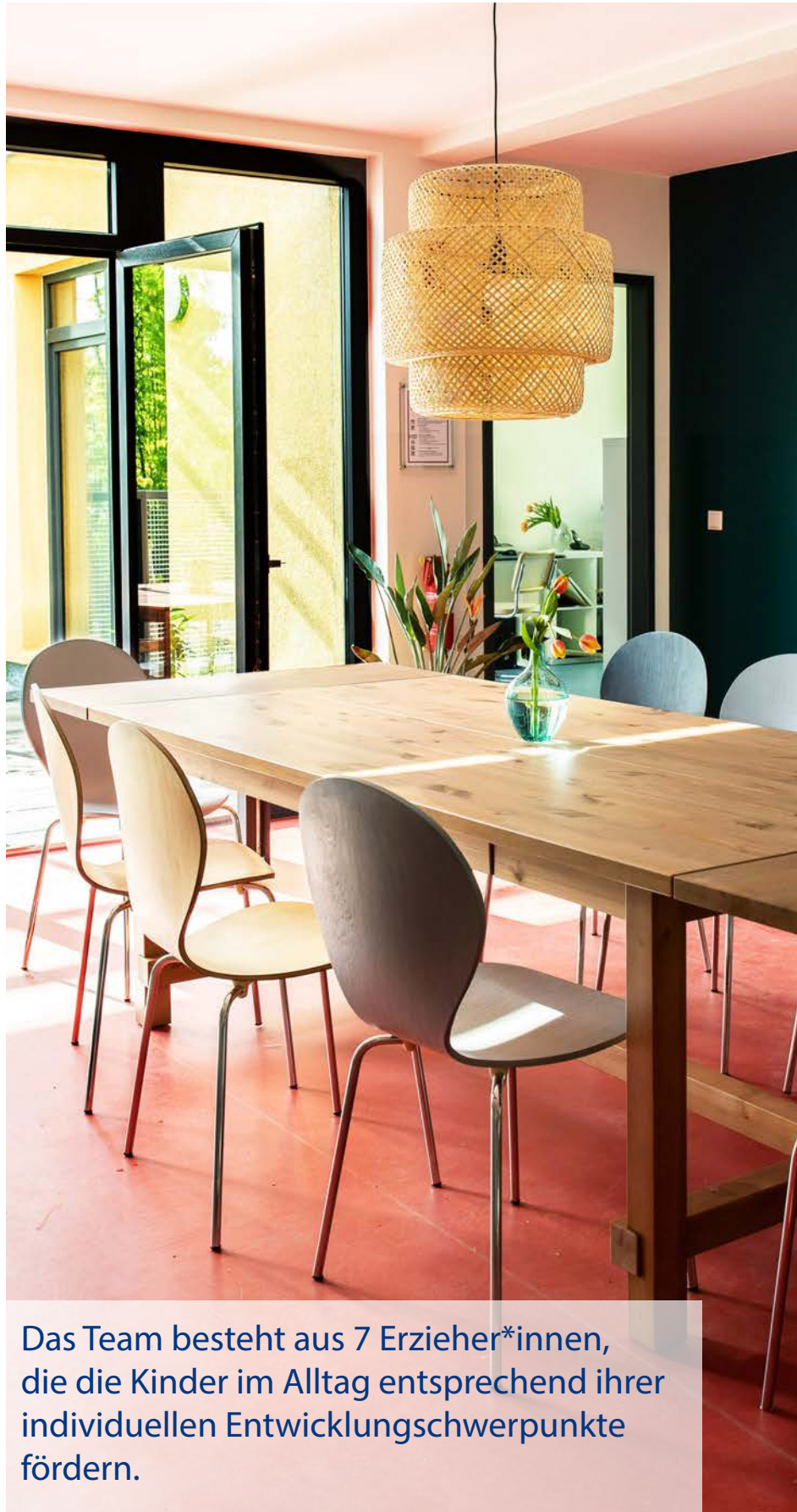
Das Team besteht aus 7 Erzieher*innen, die die Kinder im Alltag entsprechend ihrer individuellen Entwicklungsschwerpunkte fördern.

Unsere Kooperation mit der Kita „Kieke Mal“ ermöglicht im Bedarfsfall die Vergabe eines Kitaplatzes. Darüber hinaus ist die Nutzung des Sportraums und des großzügigen Außenbereichs vorgesehen.