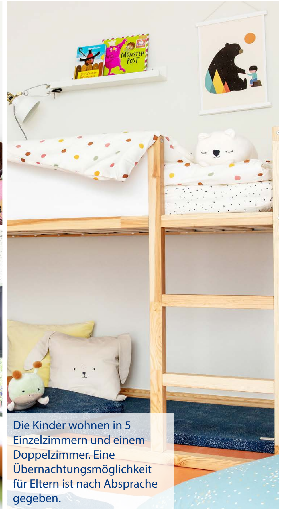
Die Kinder wohnen in 5 Einzelzimmern und einem Doppelzimmer. Eine Übernachtungsmöglichkeit für Eltern ist nach Absprache gegeben.