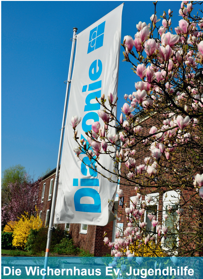
Die Wichernhaus Ev. Jugendhilfe

Seit über 75 Jahren hat das Diakonische Werk Gladbeck-Bottrop-Dorsten in mehreren Städten des Ruhrgebiets zahlreiche ambulante, teilstationäre und stationäre Angebote für Kinder, Jugendliche und Familien aufgebaut. Ziel unserer Einrichtung ist die aktive Mitwirkung an der Verbesserung der Lebensbedingungen von Familien. Die Hilfen sind ressourcen-, lebenswelt- und sozialraumorientiert. Gemeinsam mit den Jugendämtern werden individuelle, den jeweiligen Erfordernissen und Bedürfnissen angepasste Ziele erarbeitet. Unsere erfahrenen und in unterschiedlichen Fachrichtungen qualifizierten Fachkräfte begleiten und unterstützen die individuelle Hilfeplanung.