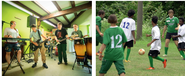
Die BBS bietet eine Vielzahl an Freizeitaktivitäten

In unserer heilpädagogischen Wohngruppe (HeiWo) finden Jugendliche ab 15 Jahren die Chance für einen Neustart. Ein Zuhause auf Zeit, frische Kraft und alternative Ideen zukünftig anders mit verzwickten Situationen umzugehen. Die erfahrenen Profis aus der BBS-Mannschaft unterstützen die Teilnehmer der eigenen Wohngruppe. Denn der Teamgeist steht bei unseren Sport- und Freizeitaktivitäten genauso im Mittelpunkt wie eigentlich bei fast allen großen und kleinen Alltagsprogrammen.