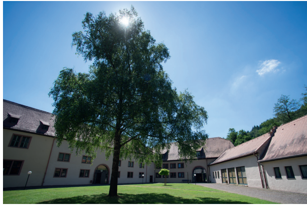
Der Innenhof der BBS Himmelthal

Wenn es im Elternhaus schwierig wird, aus welchen Gründen auch immer, dann hilft eine Auszeit: Einmal raus aus dem alten Umfeld und alle Uhren auf Null gedreht.