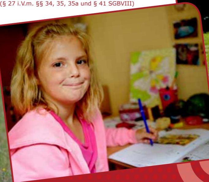
Betreutes Einzelwohnen BEW 2 Plätze ab 16 Jahre

Außenwohngruppe „Wendepunkt“ (7 Plätze, 24h Betreuung) für Mädchen und Jungen ab 4 bis 18 Jahre (§ 27 i. V. m. §§ 34, 35, 35a und § 41 SGB VIII)