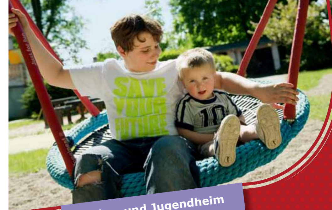
Kinder- und Jugendheim „Heinrich Zille“

Gemeinsame Chancen nutzen und Perspektiven gestalten